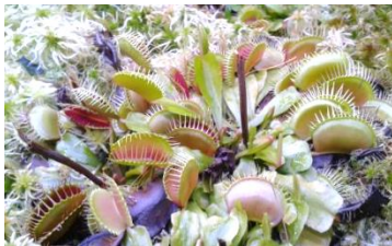
Fleischfressende Pflanzen im Botanischen Garten