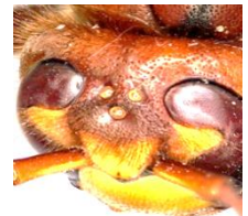
Augen einer Hornisse