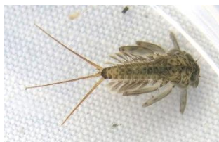
Larve einer Eintagsfliege